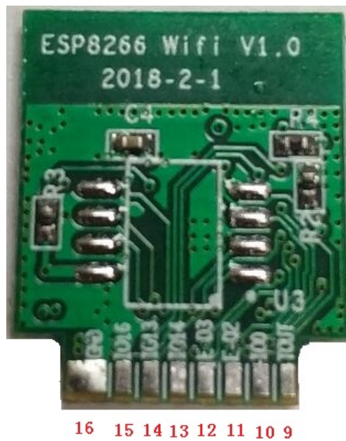
图 4 模块引脚底反面排列图