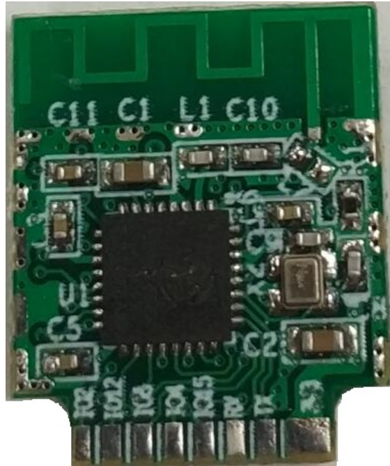
图 1 SMA-C04 正面展示