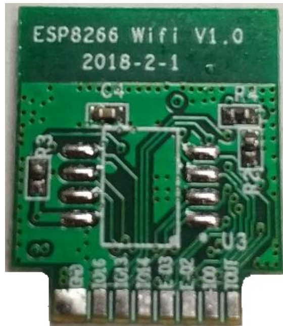
图 2 SMA-C04 反面展示