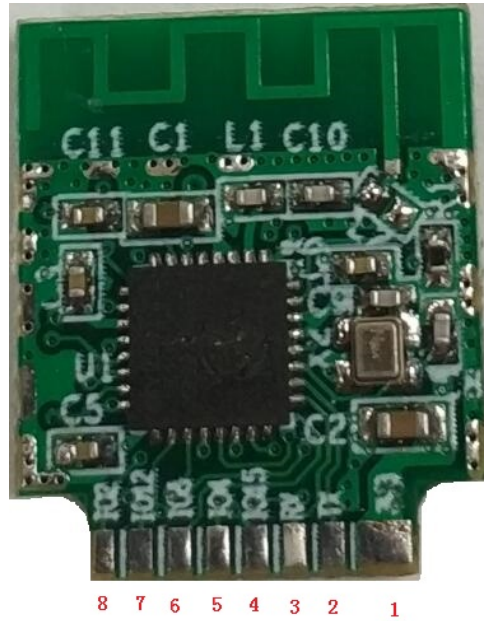
图 3 模块引脚正面排列图

SMA-C04 模块提供单通道开关控制接口, Wi-Fi 指示灯接口, UART 串口。